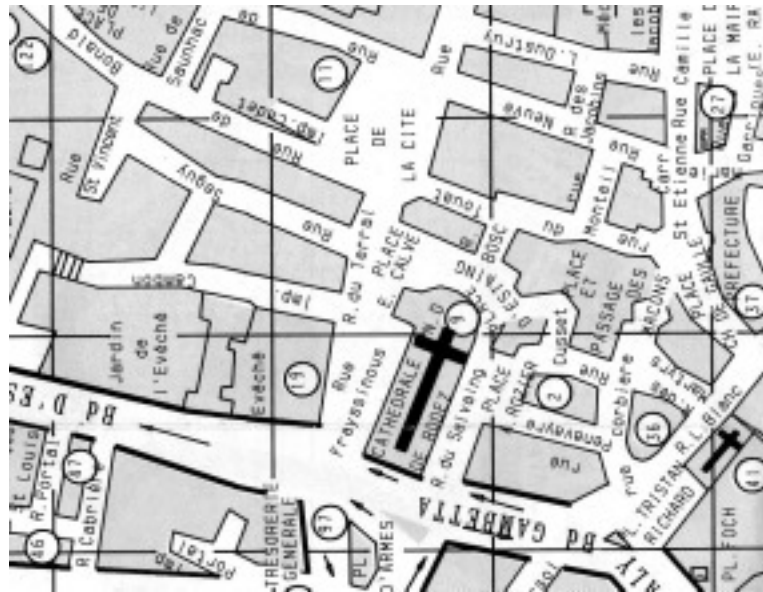
Plan actuel du quartier de la cathédrale